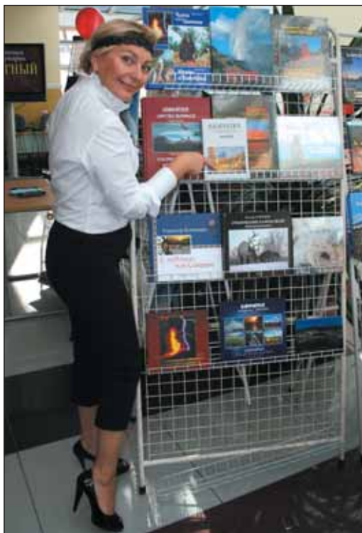
Неизменный интерес публики вызывал наш региональный сборник «Камчатка»