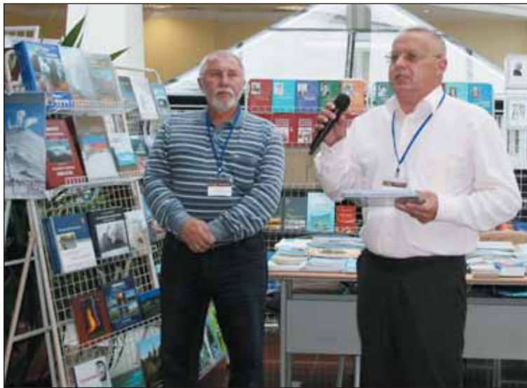
Презентация книжной продукции «Новой книги»

Владивосток, мы задавались вопросом: для чего едем? Казалось бы, ответ очевиден: показать себя и посмотреть других. Но было и кое-что другое, специфическое для нашего времени: мы решили начать постигать азбуку издания электронных (цифровых) книг. Уж очень не хотелось отстать от поезда, занимаясь только традиционной бумажной книгой. Мир меняется, цифровая книга всё активнее входит в оборот, молодежь выбирает ее. Да, традиционная книга есть и будет, за нее бояться не приходится, но и от новшеств отставать нельзя. Якутское издательство «Бичик», например, уже делает цифровые версии своих бумажных книг. И за счет этого расширяет свою читательскую аудиторию.