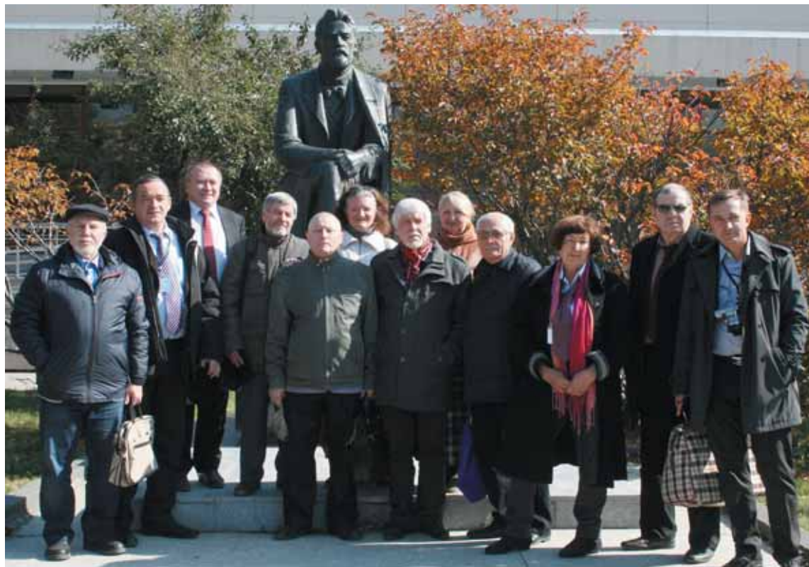
Писатели — участники фестиваля — у памятника А. П. Чехову в Южно-Сахалинске

На закрытии фестиваля участники поделились своими впечатлениями об островной земле и сахалинцах. Все писатели и организаторы со-