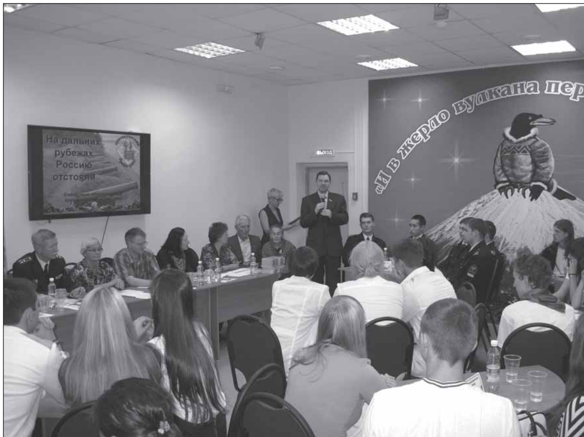
На открытии брейн-ринга

17 октября на праздничном концерте в ДК «Пограничник», посвященном