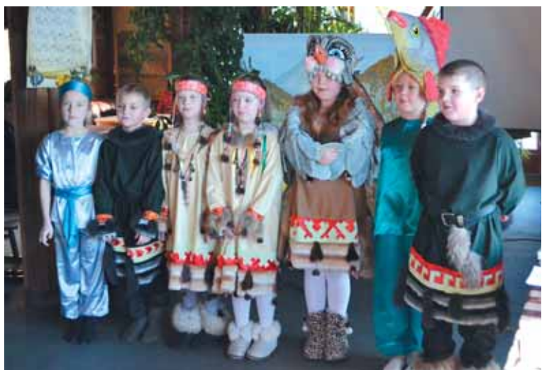
Конкурсанты в национальных нарядах

Муниципальное бюджетное образовательное учреждение дополнительного образования детей «Школа юных литературных дарований» и Департамент социального развития администрации Петропавловск-Камчатского городского округа 10.12.2014г. в Литературной Светёлке провели очередной городской конкурс знатоков литературы родного края. В очном и заочном этапах конкурса приняли участие около 150 учащихся из различных учебных заведений города: школ №№ 1, 2, 4, 7, 10, 11, 12, 21, 30, 33, 24,