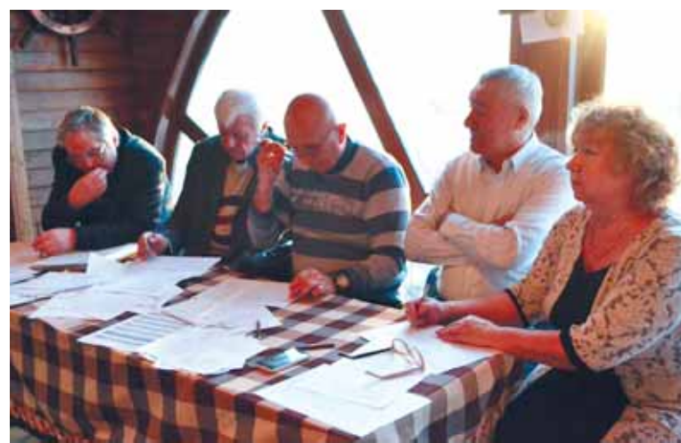
Строгое, но доброжелательное жюри

В заочном туре конкурсанты младшей возрастной группы (1–4 классы) отвечали на вопрос: «Что отличает и что сближает сказки народов севера и русские народные сказки?» А в очном их ждала викторина и интересные творческие задания. Ребята пришли в национальных костюмах, приготовили инсценировки и интересные вопросы для соперников.